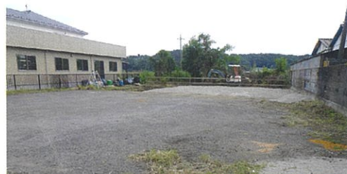
隣りの土地(整備工事中)