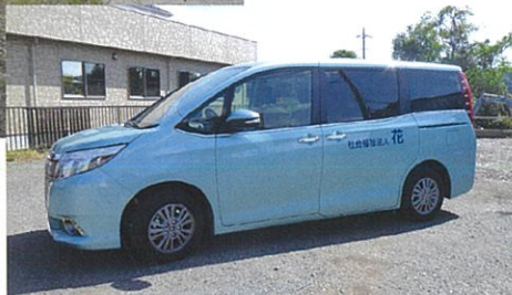
送迎車「エスクエア」

今回の制度改革により大きく変わったことの二つが「評議員会」の位置付けです。図表を使って説明すると次のようになります。〈図表1〉は主な変更点を、〈図表2〉は評議員会と理事会等との関係を表しました。平成二十九年度は、この新しい体制でスタートしたのでよろしくお願いたします。併せて、この機会に二つ報告させていただきます。一つは花の家南西側にある隣の土地のことです。これまで借用していましたが、購入の話がまとまり理事会・評議員会の承認を得られましたので取得しました。市街化調整区域に位置する雑種地であることか