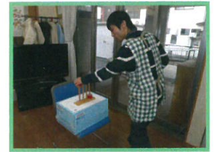
指先訓練・つまみ入れ