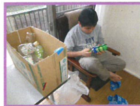
ペットボトルのラベルはがし