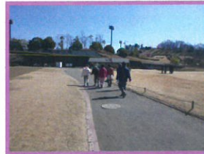
中井中央公園ウォーキング