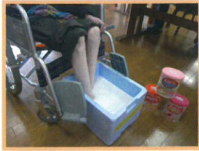
足浴 (足の冷え解消・健康維持)