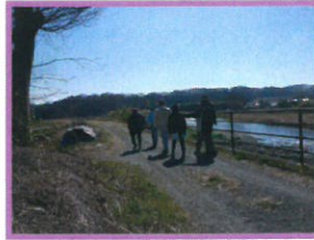
金目川沿いウォーキング