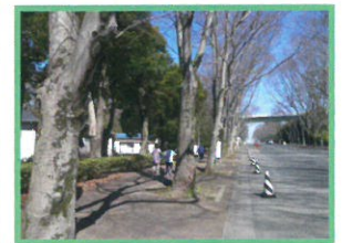
東海大学校内へウォーキング