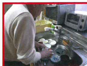
当番制で夕食の食器洗い を行っています