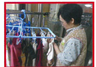
洗濯物は自分で干します