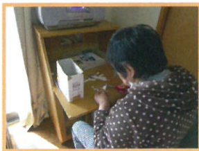
作業機での はさみを使った作業